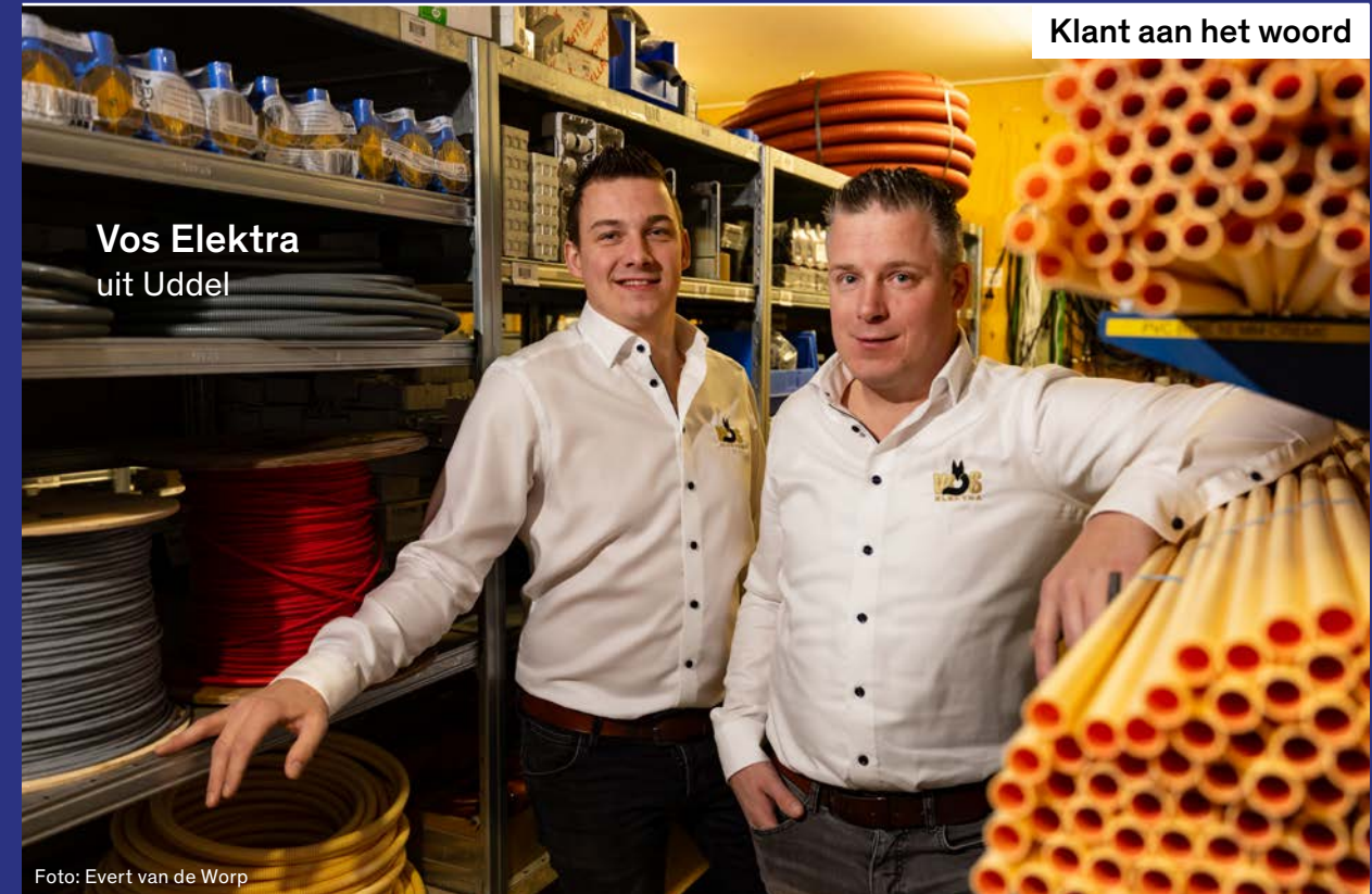
Vos Elektra uit Uddel